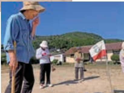
▲美土里地域女性部