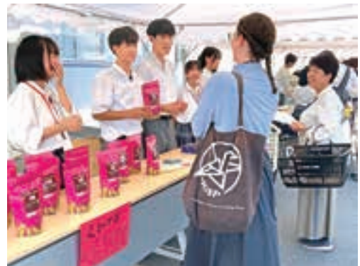
▲三矢えびす茶をPRする生徒

9月27日に広島県立吉田高等学校の駐車場で「吉高マルシェ」が開催され、会場はたくさんのお客様で賑わいました。販売ブースでは地元の特産品が多く並び、生徒達は生産者の聞き取りをもとにした店頭広告を作って商品の特長をPRしました。「地元にはたくさんさんの自慢の品があることが分かった。贈り物やお土産にぜひ利用したい」と来場者に好評でした。